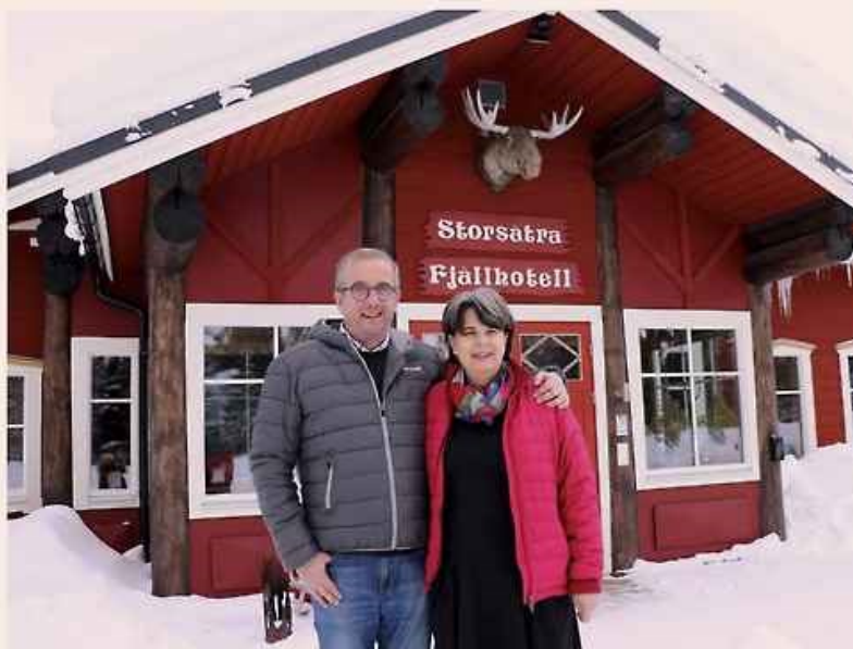
FÖRBETTRAT FÖR SKIDMÅNING. "I Grövelsjön finns över tio mil preparerade skidspår och de flesta kommer hit för långskidåkning och turkisåkning vintertid", säger paret Ericson.