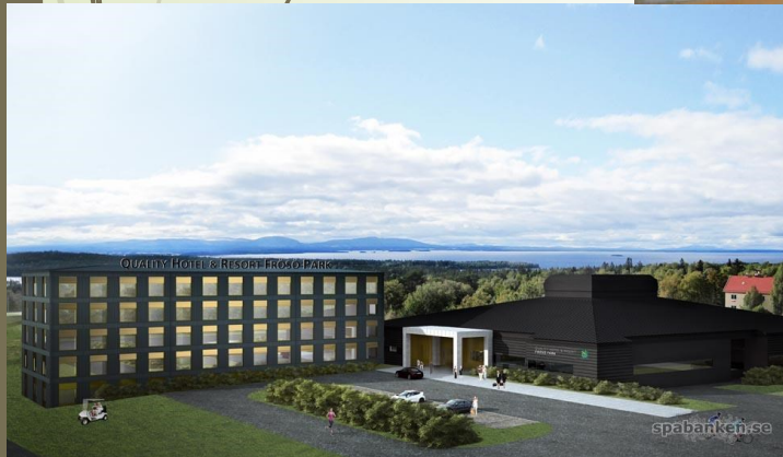
Frösö Park & Spa, Östersund