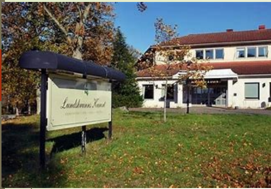
Lundsbrunn Kurort Götene kommun