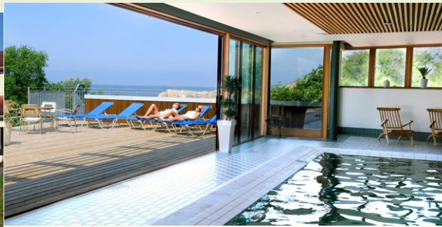
Smögens Havsbad Sotenäs kommun