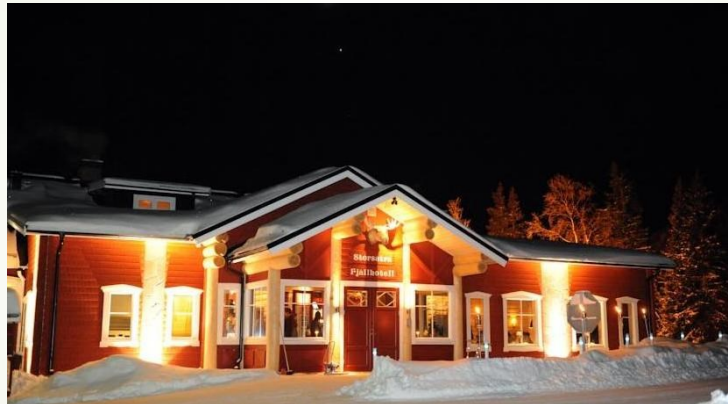
Storsätra Fjällhotell Grövelsjöfjällen Älvdalens kommun