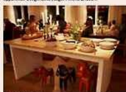
PROSELYTIT MAT. Storsåttra fjällhotell har mottagit flera satsningar. Bero på internarettiväl. Satsningen på maten med mycket lokala råvaror och KRAV-certifiering är en del av orsaken till priserna.